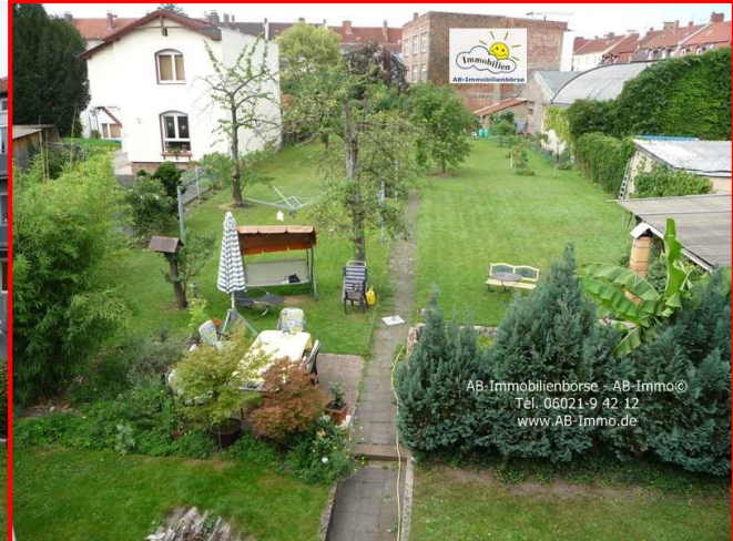
Blick vom DG → Richtung SW

Bitte prüfen Sie das Objekt durch Aussen-Ansicht, bzgl.