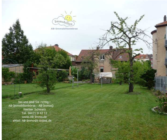
Areal ca. 1.529 m 2 Blick NO